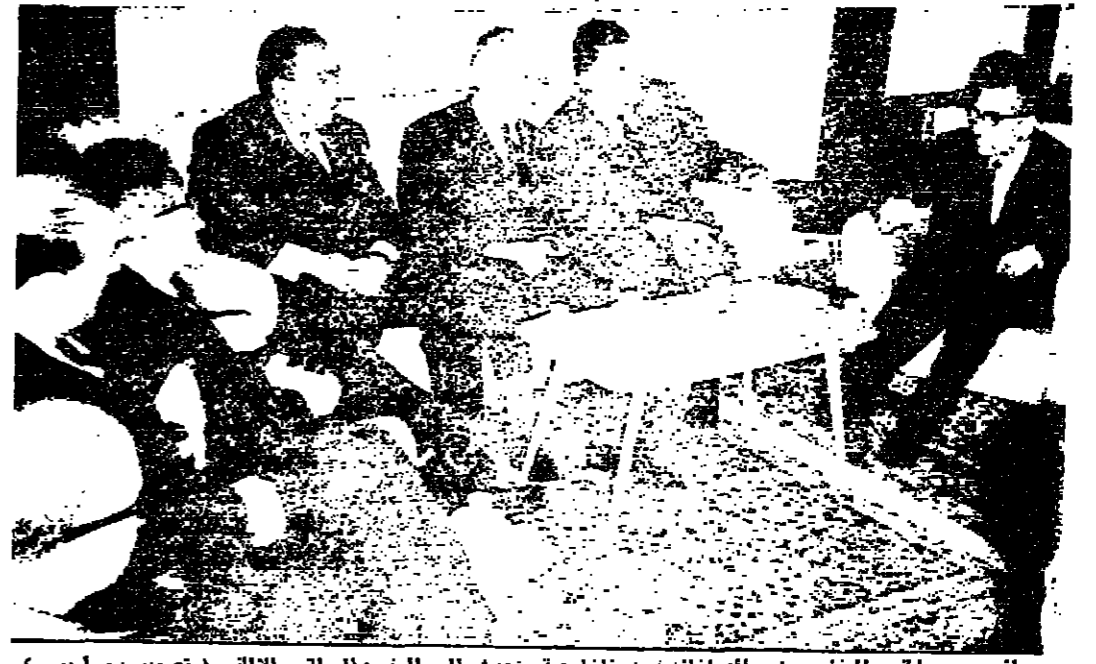
السيد عبد الحميد السائح وزير الشؤون الخارجية يتحدث الى الوفد البرلاني الالمانى